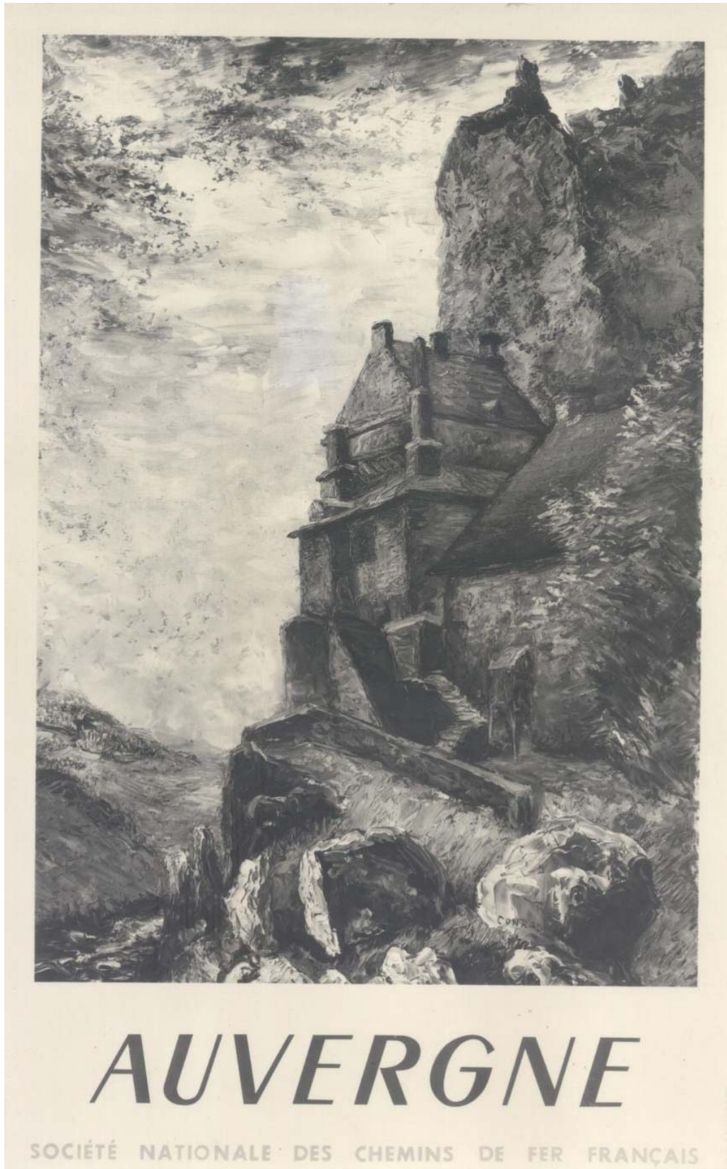
Conrad Kickert, " Auvergne ", 1947, affiche SNCF (99 cm x 62 cm).

Conrad s'est inspiré de deux paysages : St-Chamant et Vallée de la Cère . Le tableau appartient à la SNCF, il fut exposé à Utrecht (Pays-Bas) en mars 1950, dans le cadre de l'exposition " La France vue par les peintres contemporains " constituée des oeuvres originales ayant servi aux affiches des différentes régions de France.